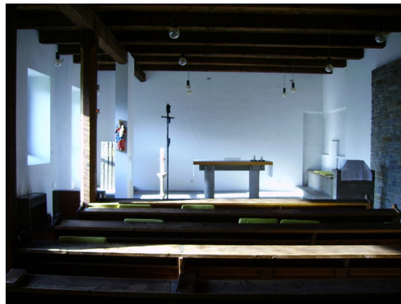
Press-Kapelle des Hauses